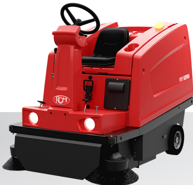
SUPRA E Scarico manuale Manual dumping Descarga manual