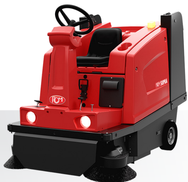
SUPRA E SA Scarico idraulico Hydraulic dumping Descarga hidráulico