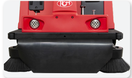
Convogliatore polvere Dust conveyor Encaminador de polvo