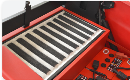
Kit filtro multitasche Polyester sach filter kit Kit de filtro de saco de poliéster