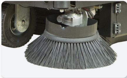
Braccio spazzola laterale sinistro Left side brush arm Brazo lateral izquierda